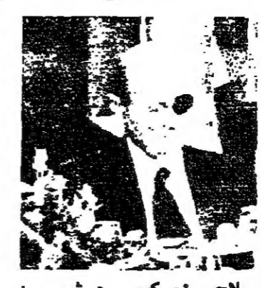
ديان وزير الخارجية الاسرائيلي اعلن فيها عن قرب التوصل الى اتفاق حول اعلان مبادىء

القوس - ديا - تواصلت الولايات المتحدة جهودها المكثفة لسد الفجوة بين اسرائيل ومصر في محادثاتهما السياسية والعسكرية ويهدف استئناف تلك المحادثات . وقد اجري الفريد اثرتون وكيل وزارة الخارجية الاميركية لشؤون الشرق الاوسط محادثات مطولة مع مناحم بيغن رئيس الوزراء الاسرائيلي وموشي دايان وزير الخارجية وعزرنه وايزمان وزير الدفاع في محاولة لتخفيف الخلافات بين القاهرة والقوس .